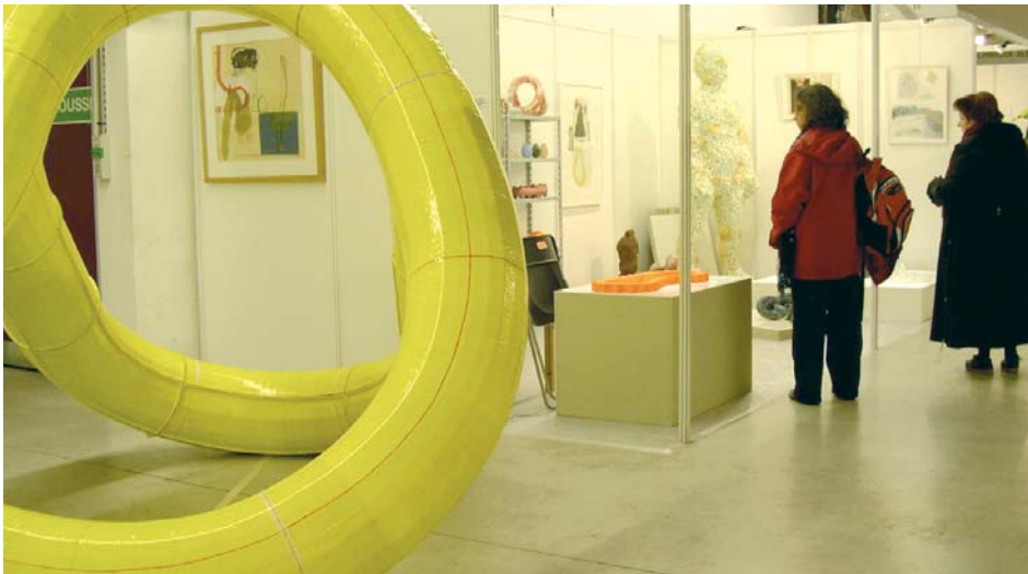
// Vue de la manifestation 2005 : Installation de Bodiou