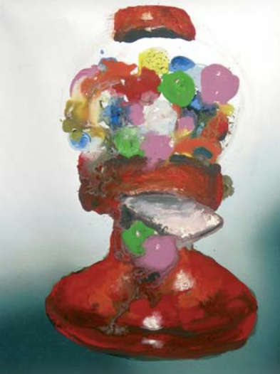
nture de T. MAHUIZIER