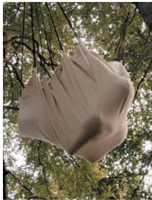
// Installation L.PERSON